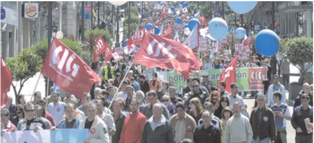
A manifestación obreira como forma de expresión

Os autores da crise, eses señores de alto prestixio social, con patoloxías de ansiedade de diñeiro, que non dubidan en moverse no fango da especulación... o blanqueo... e a corrupción, a traveso dos seus interlocutores políticos e mediáticos seguen sinalándolle o Goberno, quen deben ser os que paguen a crise..., os de sempre, os menos favorecidos da sociedade.